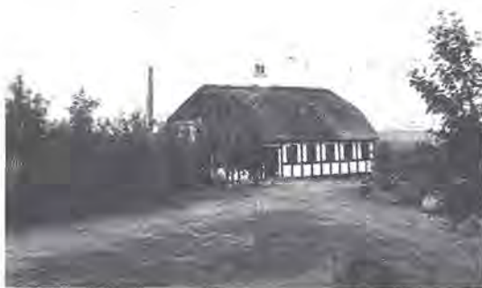
Det gamle Vranum

lemmer af orkestret var på lejr derude. Ved midnatstid gik de 8 af drengene til ro i pejsestuen. Noget senere kom den sidste fra Viborg, hvor